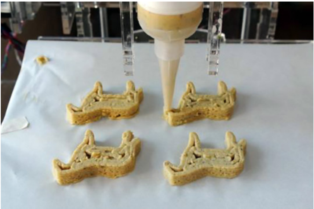
Koekjes geprint met de Foodini