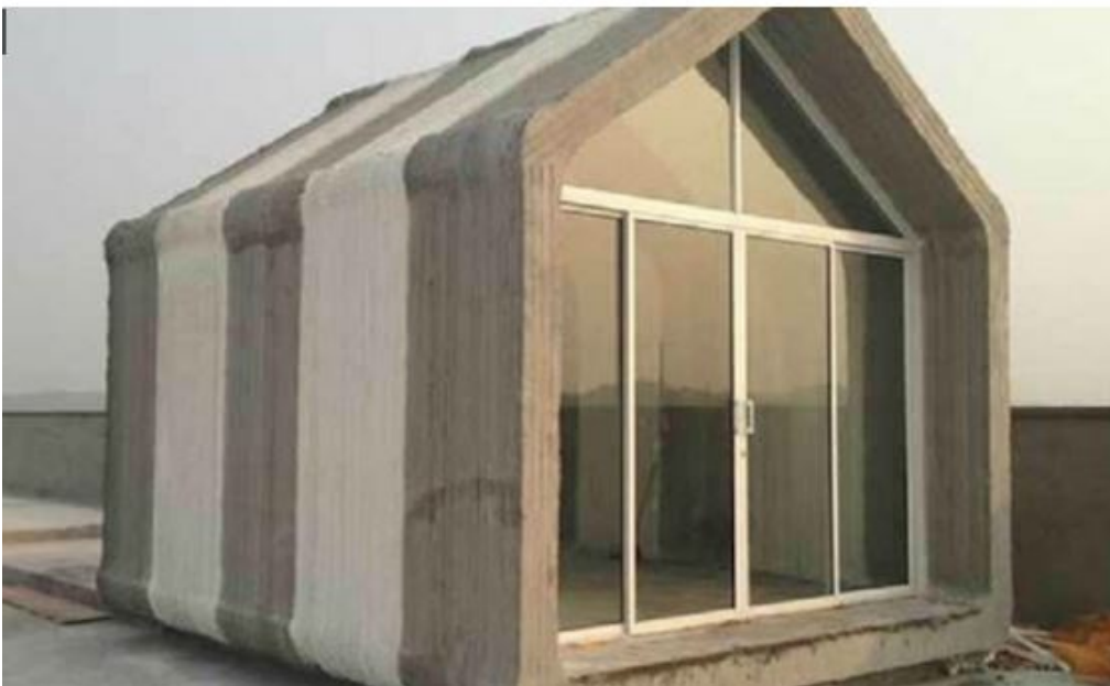
3D-printers met beton bouwen 10 huizen per dag in China