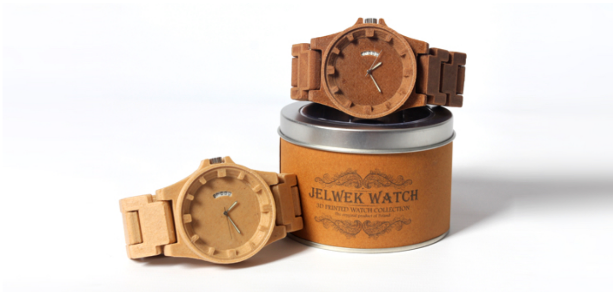
Ge-3D-printe horloges van hout ( 3Dprint.com )