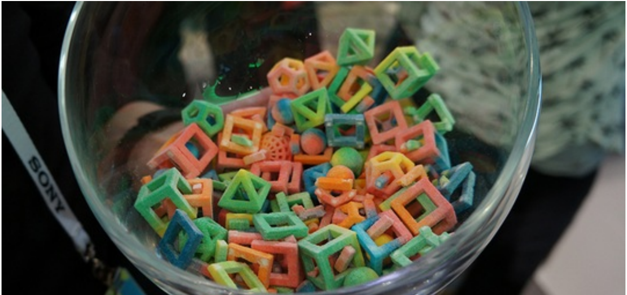
Snoep uit de 3D-printer gemaakt met de ChefJet-printer (3dprintx.net)