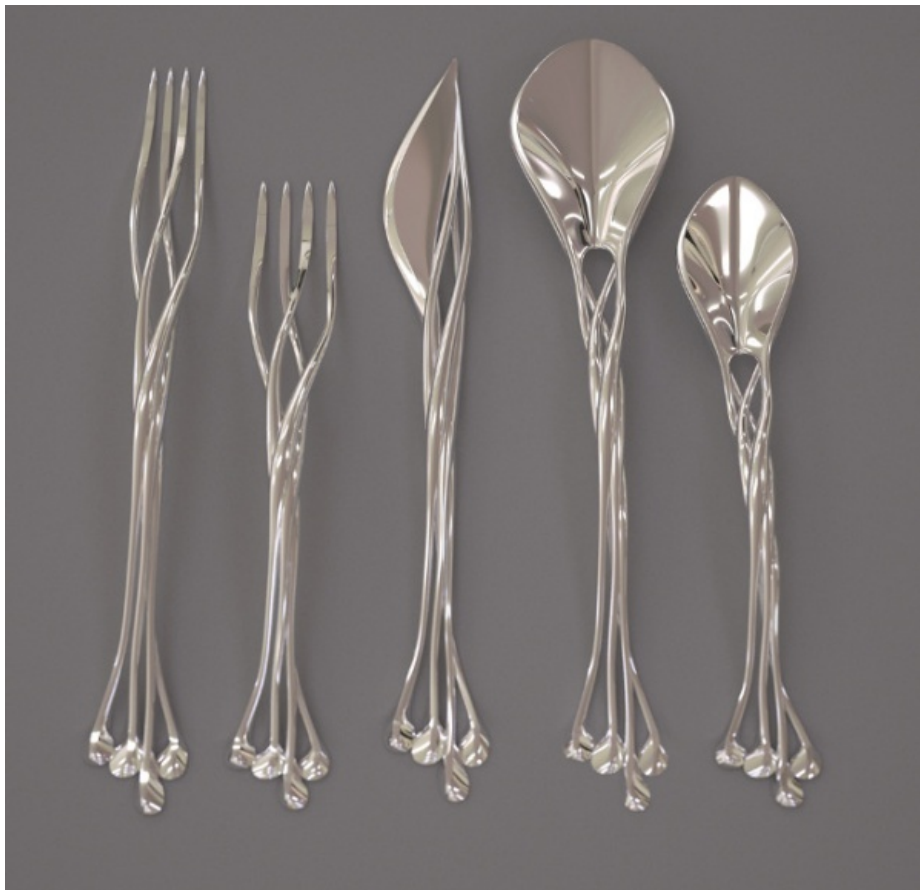
Bestek uit de metaal-3D-printer door Francis Bitonti