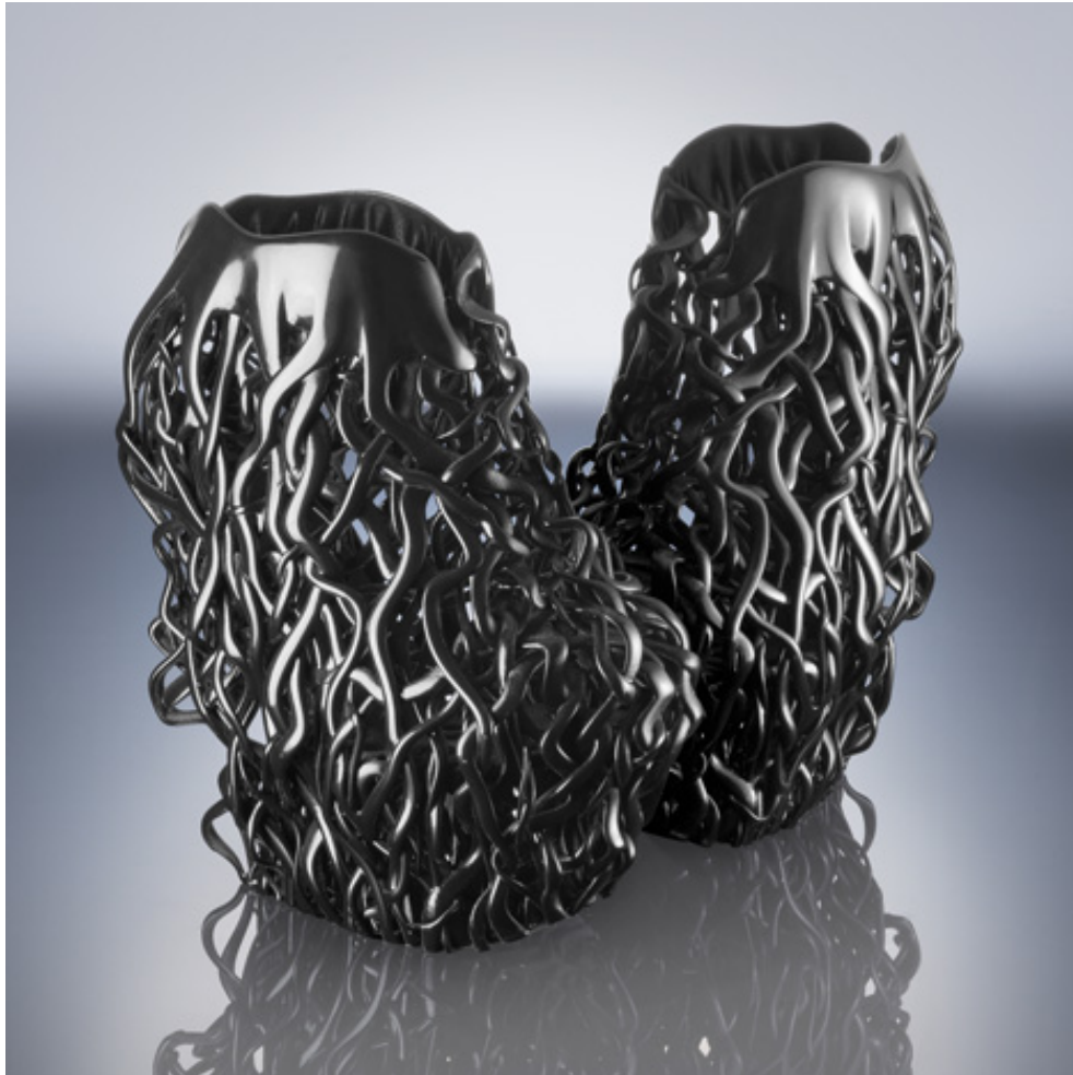
Ge-3D-printe schoenen van Iris van Herpen en Rem Koolhaas